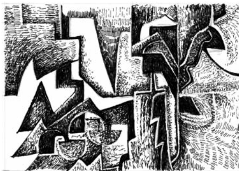
Sans titre Août 1959 24 X 31 cm. Encre de Chine sur papier