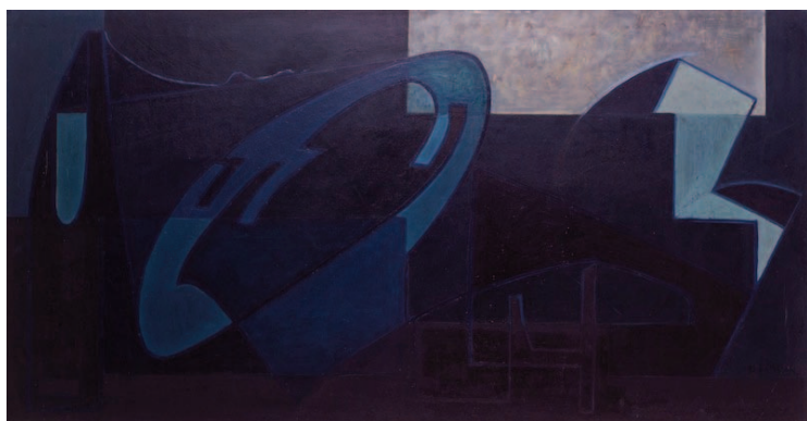
Les Exercices du trombone 1949 100 X 50 cm. Exposée au Salon des Réalités Nouvelles 1949. Huile sur bois

Puis une jeunesse où Denise Ferrier s'efforcera de percer les secrets des grands maîtres en multipliant les copies remarquables de leurs œuvres (l'exposition en présente des exemples).