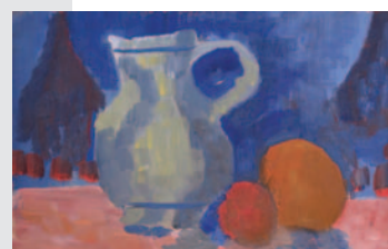
Nature morte au crépuscule 1973 23 X 15 cm. Huile sur carton