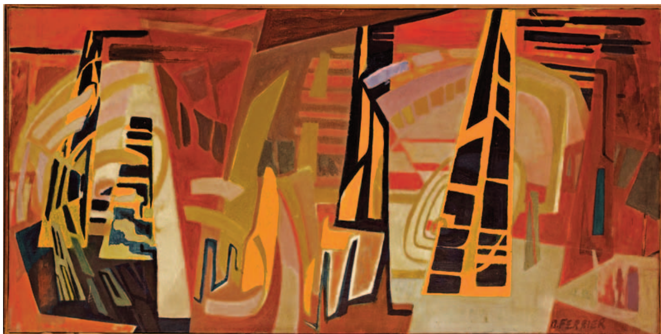
Sans titre années 50-60 40 X 80 cm. Huile sur toile

Elle fera également découvrir au public plusieurs peintures de cette époque dont certaines n'ont jamais été exposées.