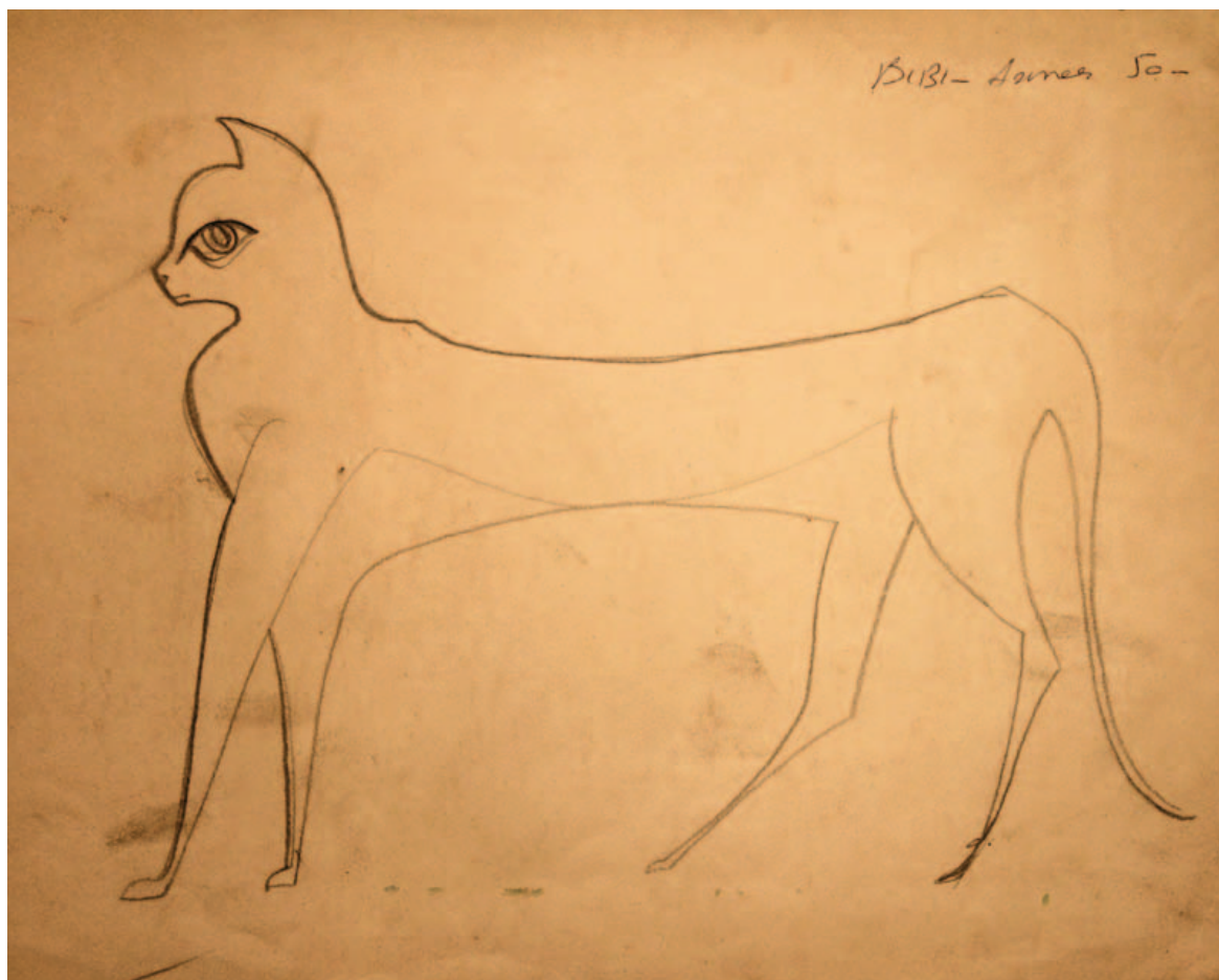
Bibi. Années 1950 32 X 26 cm. Crayon sur papier