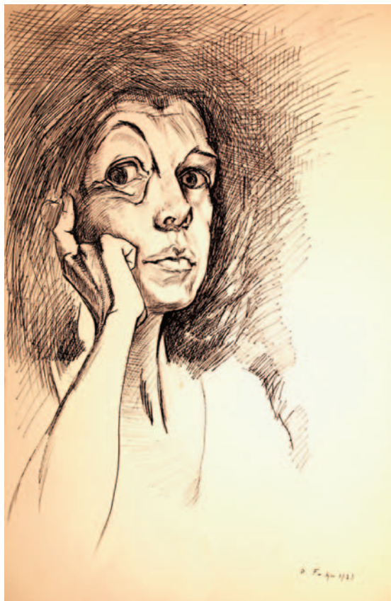
Autoportrait Mai 1973 32 X 50 cm. Encre de Chine sur papier

La puissance expressive de Denise Ferrier éclate dans ses dessins, tant figuratifs qu'abstraites. L'exposition en offre un florilège, des années 1950 jusqu'aux années 2000.